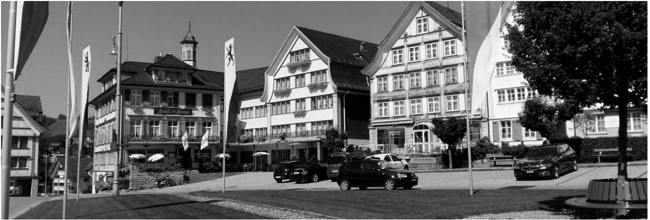
Das Hotel Krone liegt wunderschön am Dorfplatz Gais

am Samstag, 04. November 2017 um 14.00 Uhr im Hotel Krone, Gais