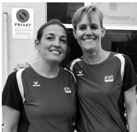
Die Vorstandsfrauen laufen im EWF -Shirt am Greifenseelauf mit;-)

Vor einem Jahr haben wir euch darüber informiert, dass wir unseren Mitgliedern den Kauf von T-Shirt und Poloshirts im EWF-Design anbieten.